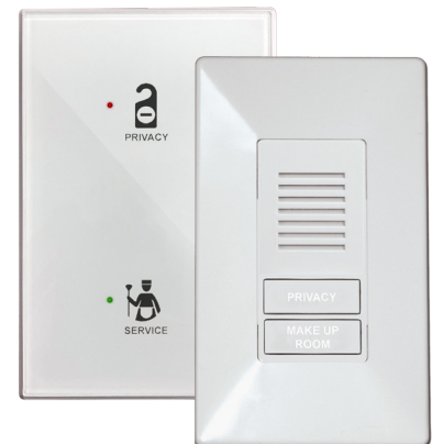
EV564 and GS564 Guestroom Annunciator and DND / MUR Control