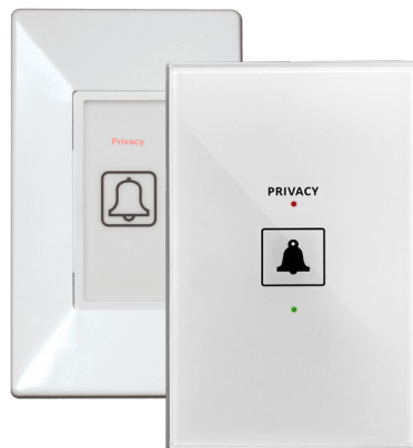
S563 and GS563 Corridor Annunciator and Doorbell Control